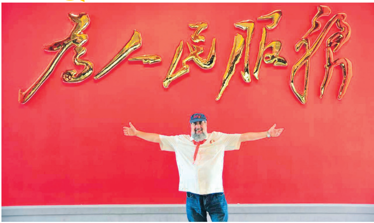
▲马克·力文在北京中南海大门口“为人民服务”标语下合影。